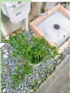
2026年1月27日： 地植え会当日の様子 (京都市立美術工芸高等学校)

2025年12月7日： 9月からヒメクチナシさんの隣が自転車置き場になりました。いつも遅刻しそうなので、自転車に乗るときに、会釈するだけの近ごろです。秋に剪定したあと、お日様の差し込む方向が時間帯によって変わるせいか、三方に枝がびーんと伸びてきました。葉はここ1,2週間の冷え込みで、縮こまってきたような。最高気温が10度を下回る日もあります。1月の地植え会の日程がもう少しで決まりそうだと聞きました。長い付き合いになると思っていたけど、アッという間にお別れが迫ってきて焦ります。残りの一緒の時間、どんな気持ちでいようかな。