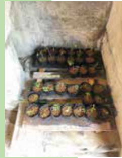
ヒメクチナシの挿し木 (2020年6月27日)