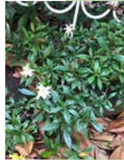
ヒメクチナシの親木 (2020年6月26日採取)

元々生育していた場所：元崇仁小学校 (2020年4月28日) 地面に植え戻した場所：京都市立美術工芸高等学校・中庭 (2026年1月27日)