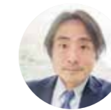
監事:四元 秀和 (京都市文化市民局文化市民総務課長)