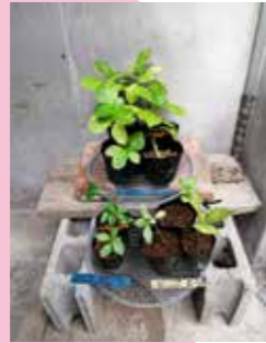
アジサイの挿し木 (2020年8月26日)