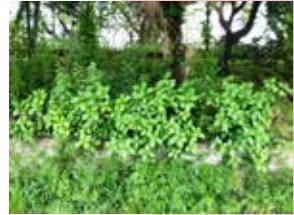
アジサイの親木 (2020年5月29日採取)

元々生育していた場所：元崇仁小学校 (2020年5月29日) 地面に植え戻した場所：京都市立美術工芸高等学校・中庭 (2026年1月27日)