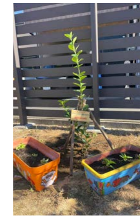
地面に植え戻した場所：稚松保育園・園庭(2024年11月7日)

稚松保育園の園庭へと植え戻したマサキは、かつては元崇仁保育所の乳児棟のお昼寝をするお部屋から見えるところで元気に育っていました。稚松保育園の子どもたちは地植えの様子に興味津々で、地植え会当日はとても賑やかで温かい時間となりました。