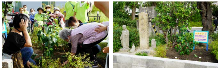
地面に植え戻した場所：柳原銀行記念資料館入口右手・柳地蔵のそば(2024年10月25日)

元崇仁第三浴場の北あたりに生きていたクちなシは、挿し木にしてから途中一度不調になりましたが、地域の方の見守りのおかげで地植えできるまで元気を取り戻しました。柳原銀行記念資料館入口の右手、地域で大切にされてきた柳地蔵のそばに地植えしました。