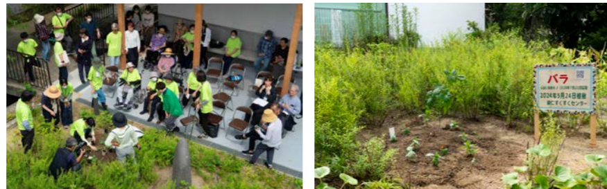
地面に植え戻した場所：柳原銀行記念資料館・東隣(2024年5月24日)

かつて元崇仁保育所に生きていたバラを、柳原銀行記念資料館の東隣(京都市立芸大敷地内)に植え戻しました。2回の不調を乗り越え、4箇所を渡り歩いたバラ。地植え会当日は地域の方々や芸大関係者を含め多くの方にお越しいただき、地面に戻る姿を見届けました。