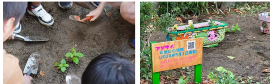
地面に植え戻した場所：京都市下京渉成小学校(2024年10月1日)

元崇仁小学校の校庭の東側(鴨川沿い)に生きていたアジサイは、京都市立下京渉成小学校の正門近くに植え戻しました。これからはこの場所で子どもたちを見守ってくださいますようにと願いを込め、渉成小の子どもたちと協力しながら地植えしました。