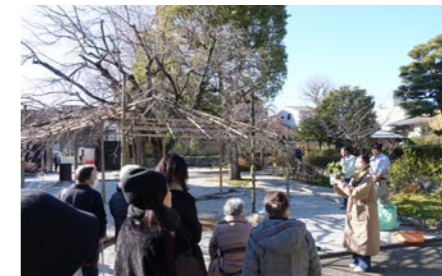
地面に植え戻した場所：渉成園西門を入ったところ(2025年1月18日)

崇仁地域にも歴史的に接点がある真宗大谷派(東本願寺)にご理解を賜り、地域の方々にも馴染み深い渉成園(枳殻邸)の一角を地植え場所としてご提供いただきました。管理を担当する加藤造園さんのご協力のもと、西門(出入口)のすぐそばにあるしだれ桜の下にアジサイを地植えしました。