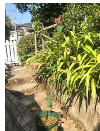
バラ (元崇仁保育所・2020年7月22日に枝を採取) ※お花が咲きました