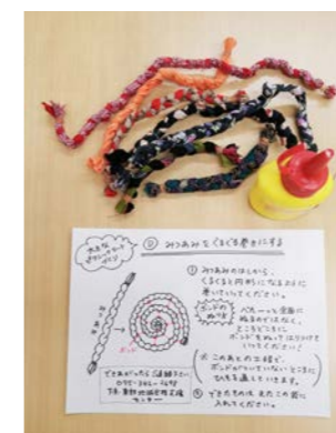
在宅ワークセット