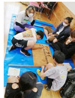
京都市立芸術大学の学生と崇仁児童館の子どもたちと一緒に

2023年度になり、徐々に本プロジェクトを知ってご理解して下さる方との出会いがあり、京都府下、京都市内、滋賀県大津市の5ヶ所で挿し木の管理をしていただけることになりました。挿し木になって3年目となり、だいぶ成長が安定しているものも増え、バラとムクゲは花を咲かせてくれました。しかし、今年度は気温の変化が著しい時期が多く、そのため不調になり枯れてしまう挿し木もありました。日々欠かさず様子を見ているつもりでも、もっともっと天候や環境に敏感に反応しないといけないのだと大変反省をしています。