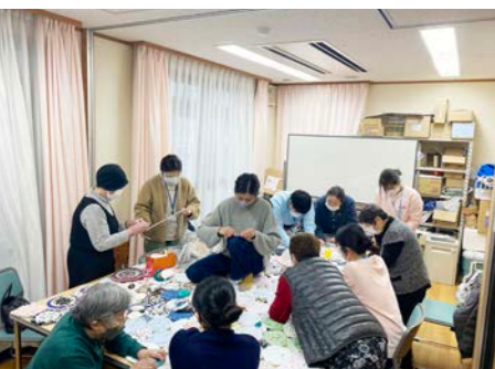
最終仕上げの様子

会期：2024年2月25日(日)～3月3日(日)10:00～17:00 ※2月27日(火) 休館 会場：京都市下京いいき市民活動センター（うるおい館）2階ロビー（〒600-8207 京都市下京区上之町38番地） 主催：崇仁デイサービスうるおい 京都市下京・東部地域包括支援センター 共催：崇仁すすくセンター実行委員会