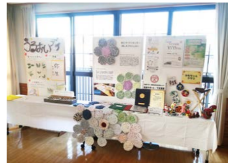
崇仁文化祭での展示風景

毎年、崇仁地域の様々な団体の取り組みや活動をご紹介されている崇仁文化祭にて、主に、崇仁デイサービスうるおいのご利用者さんやほがらか隊(毎週水曜日に有志で集まってくる地域の方々)の皆さんと制作している「大きなピクニックマット」について、制作途中の様子をご紹介させていただきました。