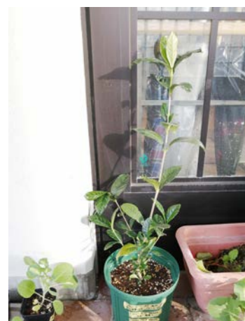
クチナシ (元崇仁市営住宅・2020年4月30日に枝を採取)