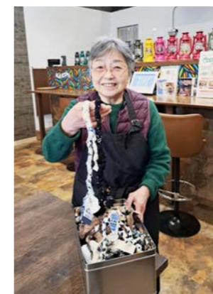
喫茶アミーでもご協力いただきました