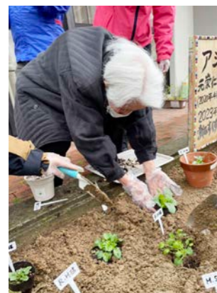
植え付け会の様子