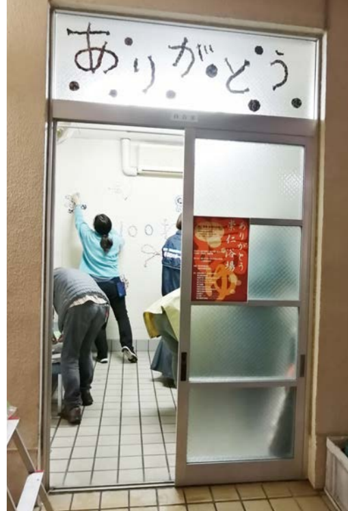
崇仁第二浴場待合室での展示装飾の様子