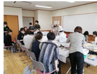
京都市立芸術大学構想設計専攻の学生との制作