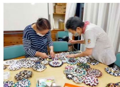
ぐるぐる巻きをひもでつなげていく