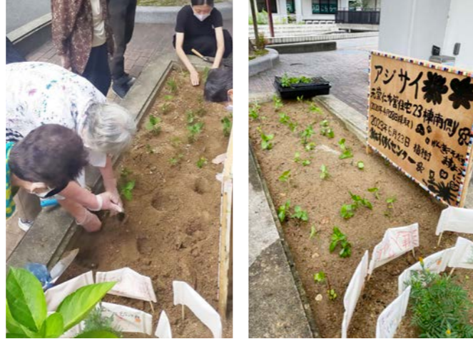
花壇西側に藍の植え付け (2023年7月5日)

アジサイの挿し木を地植えした花壇の空いているスペースで藍を育てて、生葉染め(たたき染め)をしました。金づちや工具を使ってトントンしながら、それぞれ工夫をして布に配置をし、緑から青に変化する色も楽しみました。今後、トートバッグや携帯入れなどにして活用していきます。