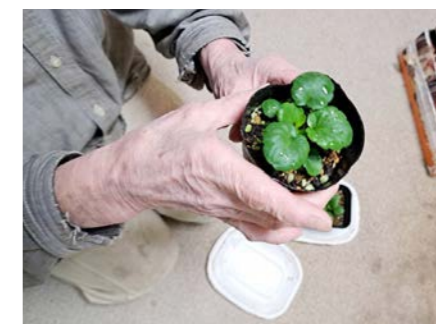
ご自宅で苗を育ててくださった方々