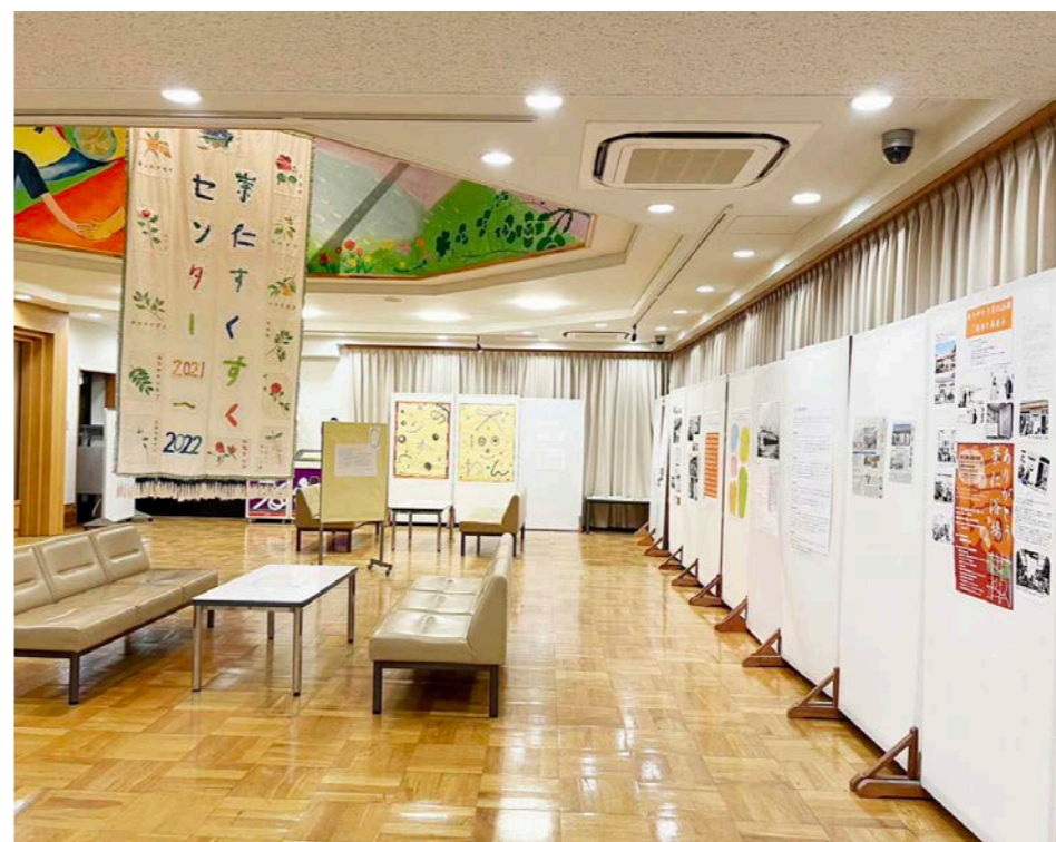
京都市下京いきいき市民活動センターでの展示・制作の様子