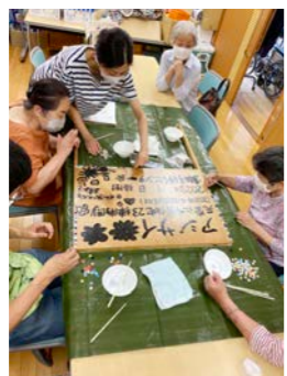
ほがらか隊の皆さんと看板を完成させる