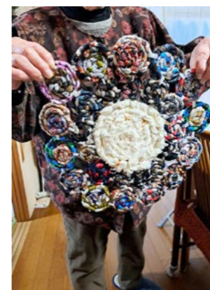
在宅ワークで制作をしてくださった方

*鉋を使って布を断つことがとても上手な、手先を使う仕事をされていた男性 *三つ編み作成方法をみんながやりやすい様に工夫した、機敏で機転の利く女性 *三つ編みの大きさや固さも均一にしたい、きれい好きで周りのお世話が好きな女性 *ぐるぐる巻きを固定するバンドを補充する、建設業をされていた男性 テーブルを出して数人集まり、そこで音楽を聴きながら普段の何気ない会話をしつつ作業をするというのが日常になっていました。自分の仕事だと捉え、自宅に持ち帰って作業をする方もいらっしゃるくらい集中(熱中!)していました。色の違いやちょっとしたデコボコも、もはや愛しい日々です。それぞれの方が自分のもっている力を結集して、このマットは出来上がっています。