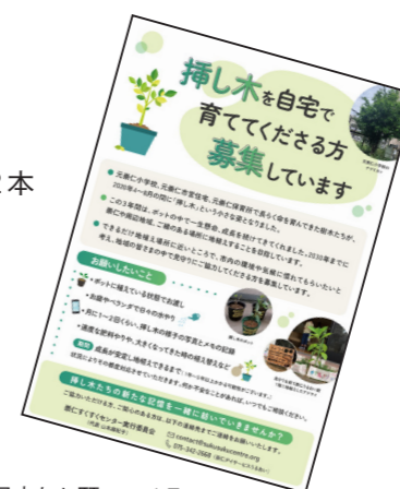
挿し木の見守りお願いのチラシ