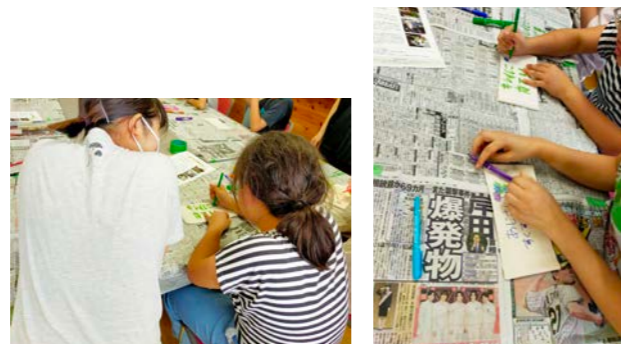
アジサイを守る猫除けのためのメッセージ布づくりの様子