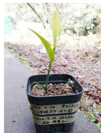
ナツミカン (元崇仁小学校・2020年6月26日に枝を採取)