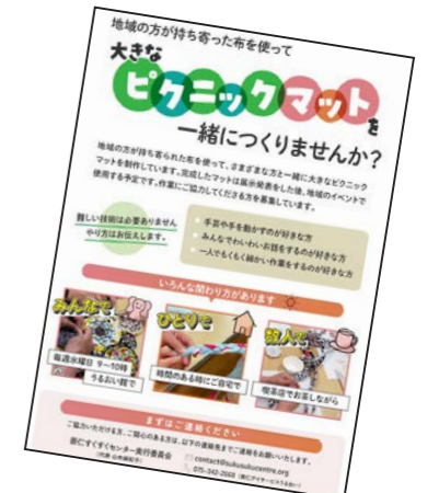
大きなピクニックマットづくりのチラシ