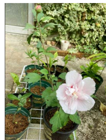
ムクゲ (元崇仁市営住宅・2020年4月28日に枝を採取) ※お花が咲きました