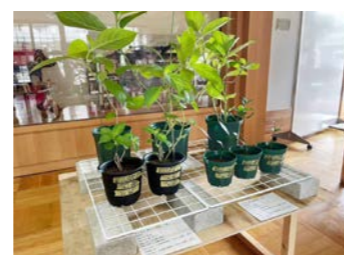
アジサイの地植え会+挿し木鑑賞会の様子