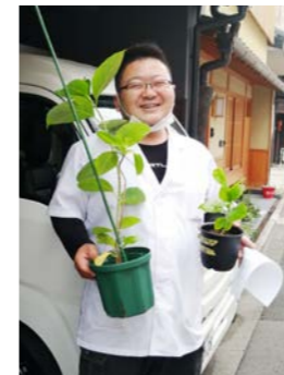
挿し木を見守ってくださった方々

2021～2022年度は、主に、滋賀県の山本のアトリエで挿し木の管理を行ってきました。アトリエが山間部にあり、何でも食べる鹿が頻りにやってくるので、屋内(土間)での管理をしていましたが、やはり植物の生育環境としては良好ではないことや、いずれ崇仁やその周辺地域などに地植えすることを念頭に置いているため、できるだけ市内の環境に近い場所で挿し木の生育を続けられるようにしたいと考えていました。