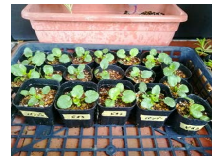
パンジーとビオラの苗