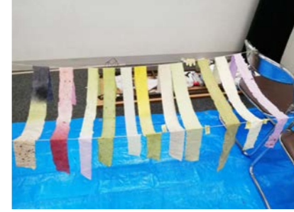
京都市立芸術大学・沓掛キャンパス内の植物で染められた布