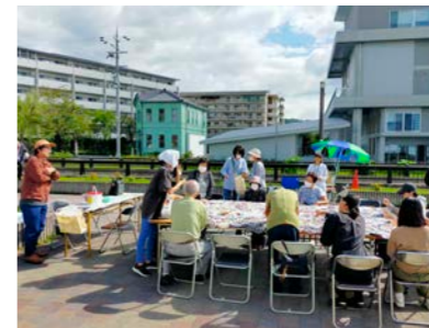
いきいきちいさな芸術祭でのワークショップの様子(蓋掛広場にて)