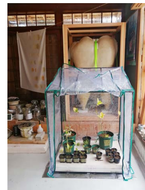
冬の間は簡易ビニールハウスの中で管理しています