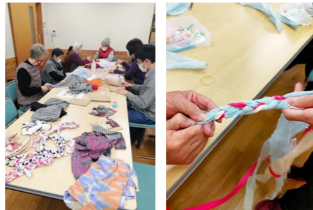
衣類を細長く切る 三つ編みをする

2024年2月に、「大きなピクニックマットお披露目会」を開催し、制作に関わってくださった方々だけでなく、たくさんの方に完成した作品をご覧いただくことができました。大学・高校の移転やコロナ禍により生活環境が大きく変わった地域にとって、コミュニティの活性化(居場所づくり・やりがい意識)につながったのではないかとたくさんのご意見をいただきました。