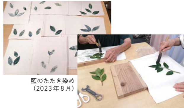
藍のたたき染め (2023年8月)