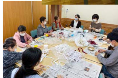
ぐるぐる巻きをつくる