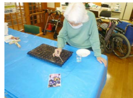
パンジーとビオラの種まき

うるおい館1階の南西角にある花壇は、崇仁デイサービスが管理をしています。その花壇の真ん中には、2023年6月に、すすくセンターの挿し木のアジサイが地植えされ、のびのびと命を育てています。その周囲を彩るため、ビオラとパンジーを種から育て、デイサービスうるおいのご利用者さんや地域にお住まいの方に、約1ヶ月の間、ご自宅で苗の成長を見守っていただきました。3月上旬に、またその苗を持ち寄っていただき、花壇に寄せ植えをしました。この花壇が、住民や地域に関わる方々が、世代を超えてつながり、集いの場所になることを目指しています。