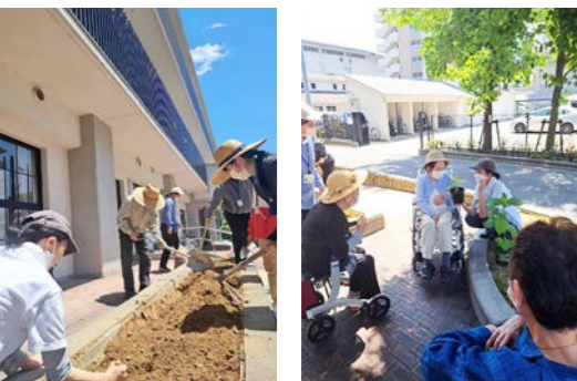
アジサイを植える花壇の土づくりの様子