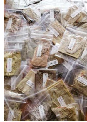
2020年度に京都市立芸術大学移転予定地内で生きていた植物で染めた布